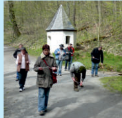
Teilnehmer beim Wunschtalweggehen

Weitere Informationen und Termine finden Sie in meiner Homepage unter „Veranstaltungen“ oder können direkt bei mir erfragt werden.