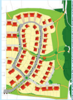
Entwurf der Feng Shui- und Geomantieberatung Dorfmund Raam

Ziel ist es für die vorhandenen Ortsqualitäten die energetisch optimalen Gestaltungsempfehlungen festzustellen, um auch dem Menschen wieder eine größere Verbundenheit zu dem göttlichen All-Eins-Sein zu ermöglichen.